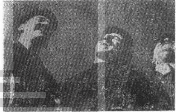
AYAK - BACAK FABRİKASINDAN BİR SAHNE

Dükalık yalnız Türkiye için değil, başka ülkeler için de yabancı değil. Çünkü, Batı Almanya'da bir tiyatro eleştirmecisi ve fikir adamı olan Brown bana, «bu eseri nasıl bizim için adapte edebiliriz diye düşündüm de pek zor gelmedi» diyordu. Öyleyse, yalnızca Türkiye'nin gerçeklerini yansıtmıyor yargısı eksik kalıyor.