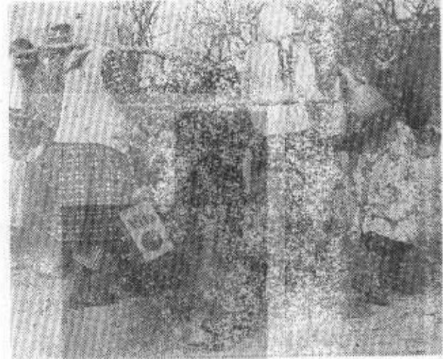
ÇOLUK ÇOCUK, KIŞ YAZ BÖYLE SU TAŞIRLAR

Bakkalın bu sözleri karşısında ne diyeceğimi şaşıyorum :