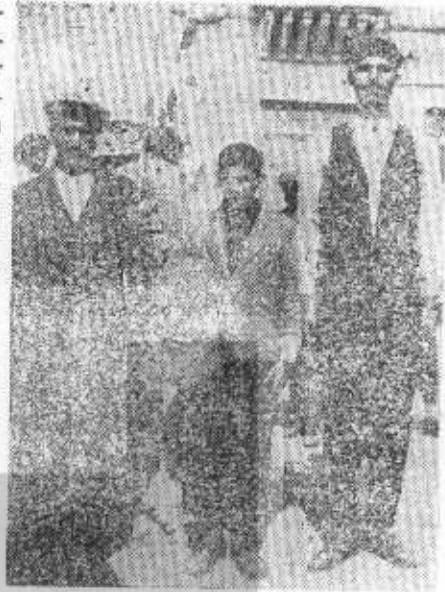
ADANA SOKAKLARINDA DIYARBAKIRLI UÇ İRGAT

Çukurova toprağı bu kısacık konuşmalar içinde Doğuluların uzun uzun öyküleriyle doluydu... Evet Çukurova toprağı canlarına tak diyen bu üç Doğulu hemşerinin bir de köydeki yaşantılarıyla ilgili öyküleri daha vardı ki, bunlar da, hepsi uzun uzun bir hikâyeydi : Köye gitmek dersen, orada kıtlık vardı. Daha Mayıs ortalarına gelmeden ekin-ot hepsi yanmış, kavrulmuş, kül olmuştu; uzun bir hikâye... Orada ne yiyip ne içeceklerdi, borçlarını nasıl ödiyeceklerdi; uzun bir hikâye... Bir kere üçünün de köylerinde bir karış toprakları yoktu. Köyleri yetmiş haneydi. Bu yetmiş hane, dedelerinin dedelerinden beri yerli bir ağanın top-